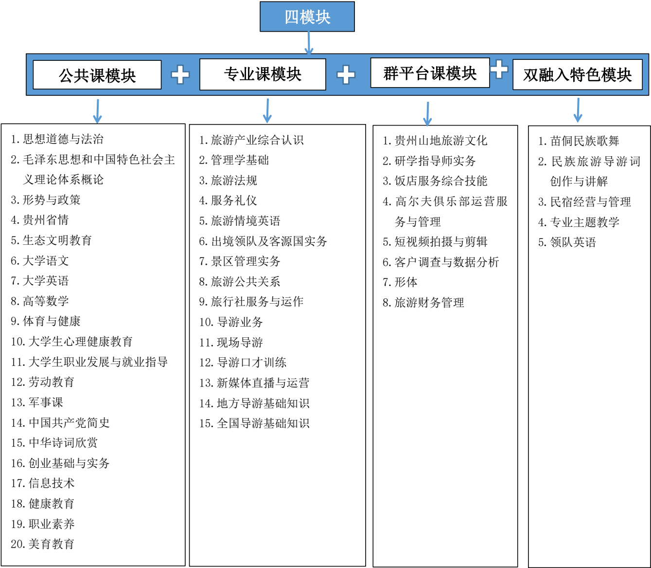
图 1 旅游管理专业“四模块、三阶段、两方式”课程体系图

块、三阶段、两方式”的课程体系，即课程结构模块化：公共课模块+专业课模块（专业基础课程+专业核心课程）+双高专业群平台共享课模块+苗侗文化特色课程；专业课程内容分阶段进行：学校课程+校企课程+企业课程；专业教学采用两方式：关联课程项目化教学+个性内容主题式教学，动态调整课程内容和学时，开发专业课程系列苗侗民族文化主题设计教学方案及教学资源，通过“旺作（实践）淡学（教）”，突破旅游淡旺季瓶颈，实现工学交替。